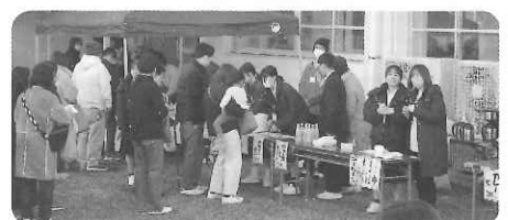
バザー パンやコーヒー等