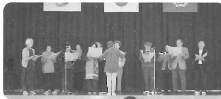
サークル 舞台発表