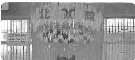
北陵高校 折り鶴アート