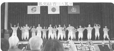
若楠小 チーム若楠