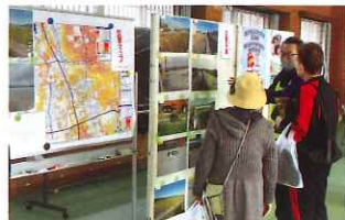
来場者に浸水被害を説明するスタッフ

今回は、平尾地区の浸水被害(令和3年)の写真展示、城北中学校生徒会による説明コーナー等が新たに設けられました。また、県防災士会による災害時トイレの紹介や家具の固定、防災グッズの展示があり、消防署によるAED体験には多くの方が足を止め、実際に体験されました。