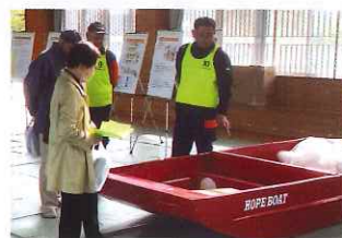
平尾地区にはボートが備えられています