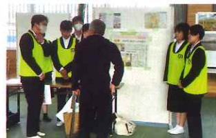
自分たちの取り組みを説明する城北中生徒会