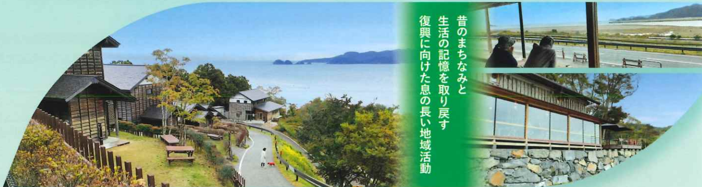
2023年度 国土交通大臣賞(特定非営利活動法人 りあすの森)(宮城県石巻市)