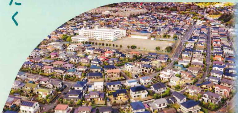
2023年度 住まいのまちなみ優秀賞(上郷ネオポリス自治会)(神奈川県横浜市栄区)