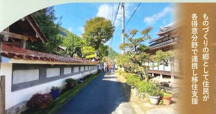
2023年度 住まいのまちなみ賞(一般社団法人 西郷工芸の郷あまんじゃく)(鳥取県鳥取市)

※受賞団体には、30万円(1団体・1年あたり)を 3年間、維持管理活動の推進の ために支援します