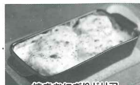
焼きおにぎりドリア