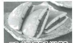
フライパンで作るどら焼き