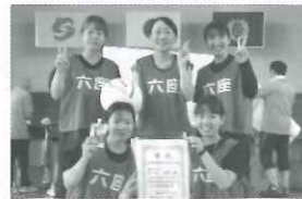
【女性Aパート】 六座町