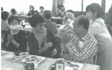
～ 誕生者へ お花のプレゼント ～