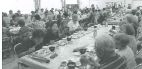
～ 笑顔で会食「おいしいね！」～