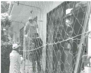
～ ネット張り、土づくり、苗植え (5/16) ～