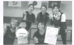
【女性Bパート】 多布施三