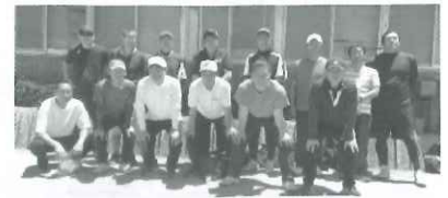
【南パート】 優勝 末広西部