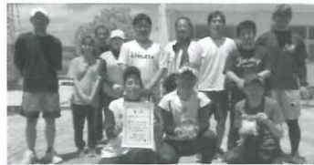
【北パート】 優勝 中折下