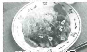
鶏むね肉のドンテキ風