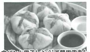
食パンと電子レンジで簡単肉まん