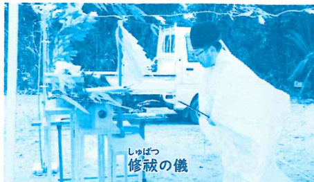
しっばつ 修祓の儀