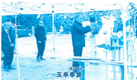
ほつでん 玉串奉奠