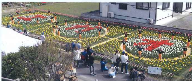
第17回チューリップまつり会場全景 (エガオの花文字)

※R208号とサイクルロード高架陸橋の交差点地点 ※高架の下には「小杭(おぐい)バス停」あり