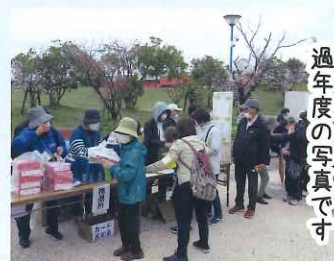
過年度の写真です