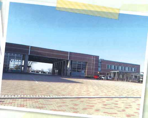
佐賀市産業振興会館

プロジェクトメンバーとして、ご協力いただける方は、コチラから入力をお願いします。