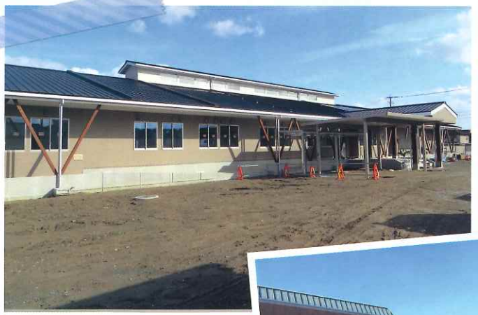
建設中の新諸富町公民館