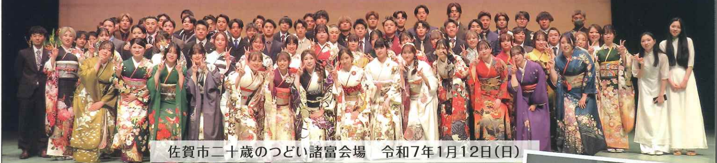
佐賀市二十歳のつどい諸富会場 令和7年1月12日(日)