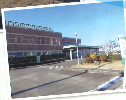
佐賀市諸富文化体育館 ハートフル