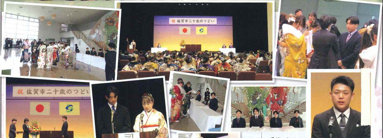
祝 佐賀市二十歳のつどい