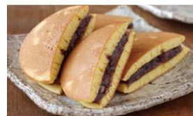
フライパンで作るどら焼