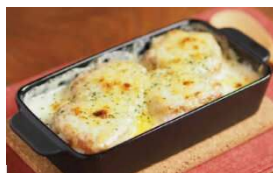
焼きおにぎりドリア