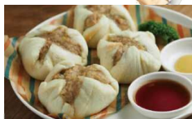
食パンと電子レンジで簡単肉まん