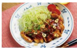
鶏むね肉のトンテキ風