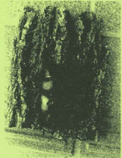
昨年生まれたオオクワガタ (オス SR血統 能勢)

希望者には、夏休みの観察にピッタリな、メダカを無料でお譲りします。大切に育ててね。 【楊貴妃（紅帝）、サタン（ひれ長）、ラメ入り】