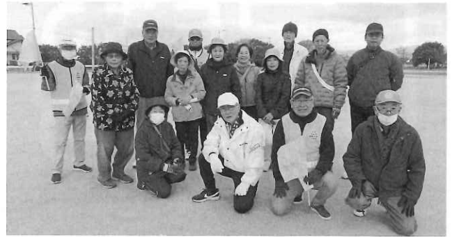
巨勢まちづくり協議会・巨勢公民館主催