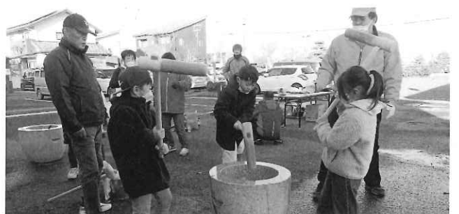
巨勢まちづくり協議会・巨勢公民館主催