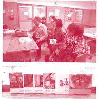
フォトブック完成