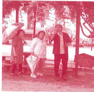
雨の撮影にチャレンジ！