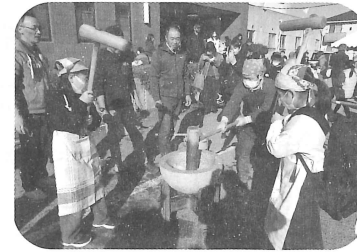
5年生とJA嘉瀬青年部による餅つき