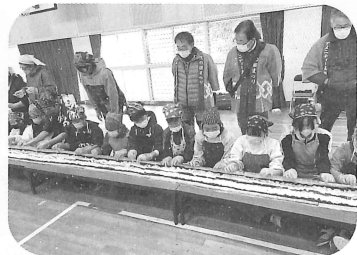
6年生と子ども会によるロング巻き寿司