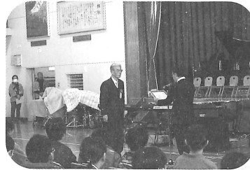
嘉瀬公民館表彰式の様子

最後に商品券などが当たるお楽しみ抽選会が行われました。1,000枚用意していた抽選券はほぼなくなり、参加した方は、持っている抽選券が当たるのかワクワクした様子で、最後まで大いに盛り上がりました。