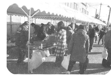
各種団体による模擬店