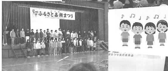
体育館のステージ発表