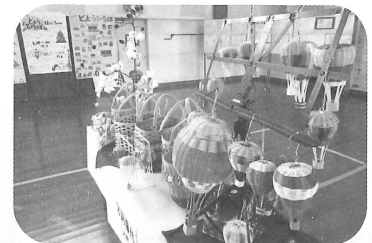
体育館後方の作品展示