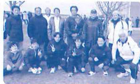
選手とスポーツ協会のみなさん