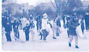
もぐらうちのようす

子どもたちは、それぞれの町区を「もぐらうちの歌」を歌いながら、一軒一軒回り勸興小学校グラウンドに集まり、勢いよく立ち上がった煙や灰を浴びて1年元気に過ごせますようにと祈りました。焼きもちの提供もあり、みんなでおいしくいただきました。