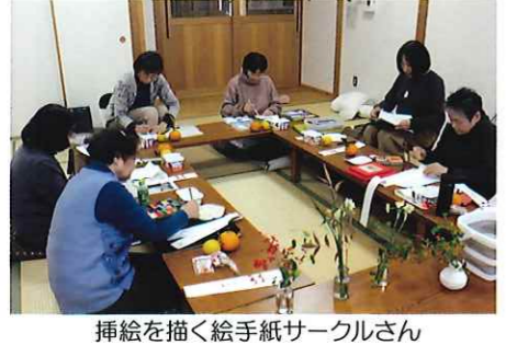
挿絵を描く絵手紙サークルさん