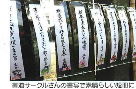
書道サークルさんの書写で素晴らしい短冊に