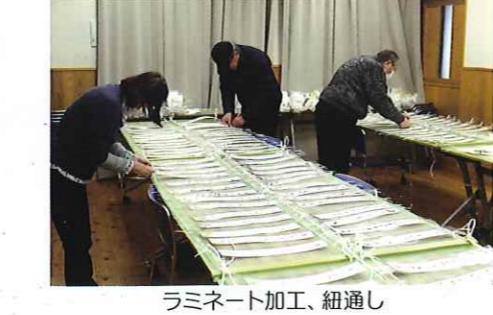
ラミネート加工、紐通し