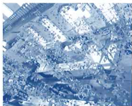
昨年の旧古賀銀行(二階から)

今年で25回目のひなまつり。佐賀市では昨年に引き続き、来場者をおもてなしするため、会場の1つである旧古賀銀行(循誘校区・柳町)を折紙の吊るし飾りでいっぱいにする「Hotomeki(ほとめき)作戦」が行われます。