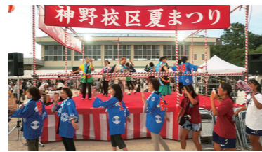
神野校区夏まつり2024