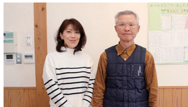
春日北まちづくり協議会のみなさん