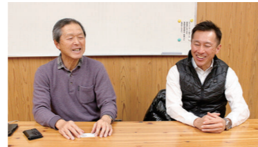
神野まちづくり協議会のみなさん

小学生のキッズダンス、中高生の吹奏楽部による演奏、恒例のお楽しみ抽選会と花火で例年に増して盛り上がったそうです。「神野芸術祭」は、小学生高学年の踊りや合唱、そのほか音楽演奏や手品が披露され、保護者、地域の方々に大盛況でした。両イベントはコロナ前より来場者が増え、世代を超えて喜ばれるイベントでした。