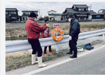
水難救命具の設置

防災訓練や見守りパトロールな ど、地域住民が連携した安全な まちづくりを展開しています。