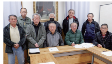
大詫間まちづくり協議会のみなさん

ウィン」で、地域の人たちから子どもたちがお菓子をもらえ、とても楽しいイベントです。2年前からは大詫間を盛り上げる「ふれあい夏祭り」も実施。また先人達は昔から水害と干ばつに悩まされてきました。現在は水の不安は解消されましたが、筑後川上流のダムの見学等で災害教育、防災意識を高めるため活動も行っています。