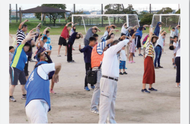
校区一斉ラジオ体操

高齢者サロンや健康教室など、 住み慣れたまちでいきいきと生活 できる環境づくりを進めています。