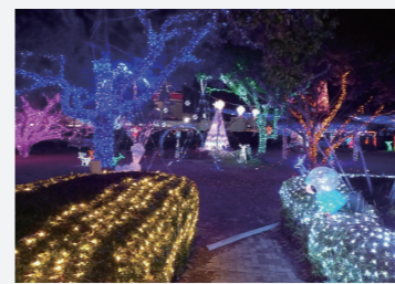
ライトファンタジー

地域の子どもたちや住民が装 飾したイルミネーションで幻想 的な空間を生み出しています。