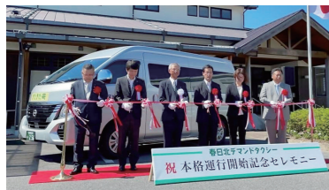
春日北デマンドタクシー「きたきた号」