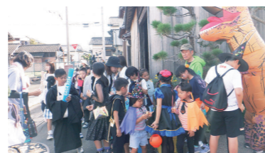
大詫間ハロウィン