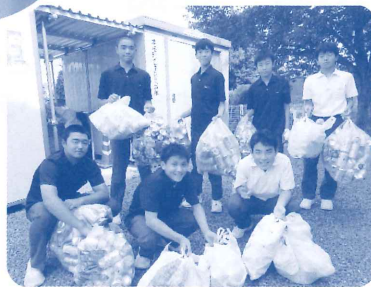
▲生徒会によるアルミ缶の回収