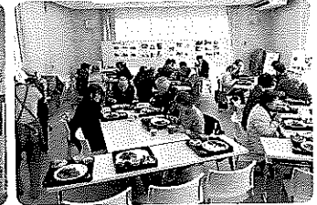
わろてんしゃいカレー