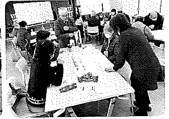
グループで話し合い