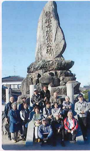
龍造寺隆信生誕地