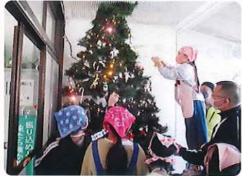
みんなでツリーの飾り付け