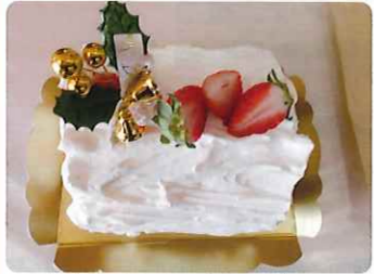
かわいいノエルケーキの できあがり