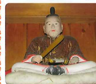
(旧蓮池社に祀られていた直澄公の木像)

寛永16年(1639年)勝茂公より蓮池を中心とした所領5万2000石と41人の家臣を分与され、蓮池藩が始まりました。