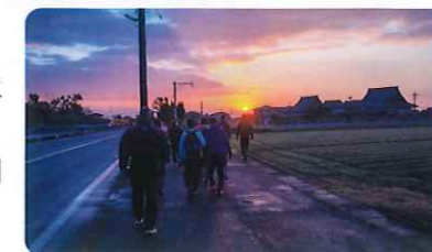
令和6年元旦の歩こう会