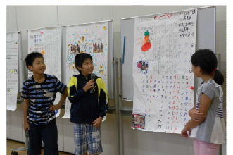
閉会式では班ごとに発表