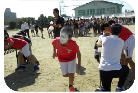
男女生徒白面小僧