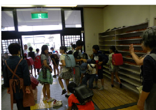
スタッフに見送られて登校!