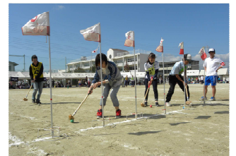
ホールインワンリレー