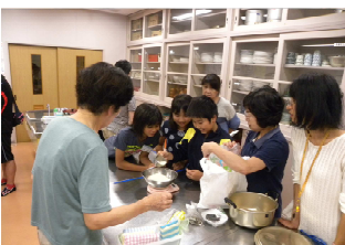
翌日の朝食の仕込み