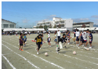
ボール蹴りリレー