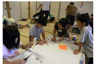
合宿の成果を壁新聞に