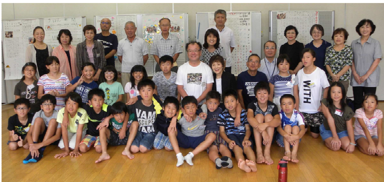
参加者・スタッフ一同で記念撮影!