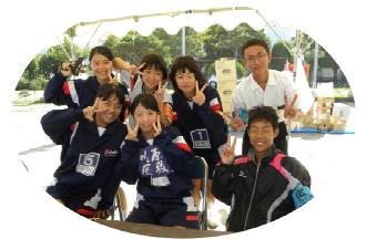
中学生ボランティアの皆さん

前日に降った雨の影響がありましたが、スタッフの尽力と天候が回復に向かったことで、無事に開催することができました。