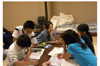
OB・OGによる学習支援