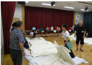
寝床も自分達で準備